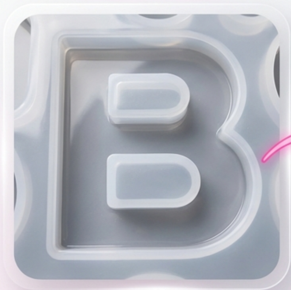
1. Molde Vazio