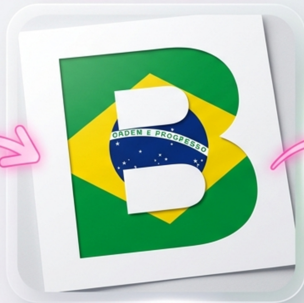
2. Papel e Impressão